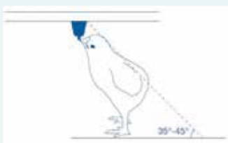
Bij kuikens (eerste dagen) maakt de rug een hoek van 35-45° met de stalvloer.