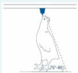
Bij oudere dieren maakt de rug een hoek van 75-85° met de stalvloer. Het dier moet zich strekken om te drinken.